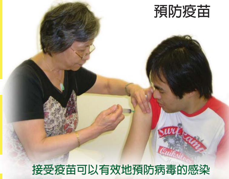
接受疫苗可以有效地預防病毒的感染

全國華人保健中心 CHINESE NATIONAL HEALTHY LIVING CENTRE